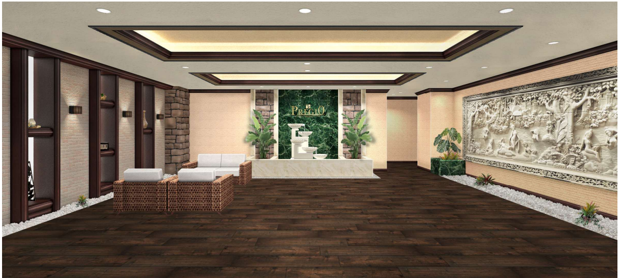
【エントランスホール イメージパース】

エントランスホールは、アジアリゾートの優雅さと上質さを兼ね備えた、住まう人を優しく包み込む迎賓空間です。内部には、バリ現地の職人が丁寧に手彫りしたストーンカービングを配し、異国情緒あふれる芸術的な空間を創出しました。木調の素材と柔らかな間接照明が美しく調和し、日常を離れた安らぎを感じさせます。細部にまでこだわり抜いた意匠が、居住者や来訪者にリゾートホテルのラウンジを訪れたかのような高揚感と癒しを提供します。