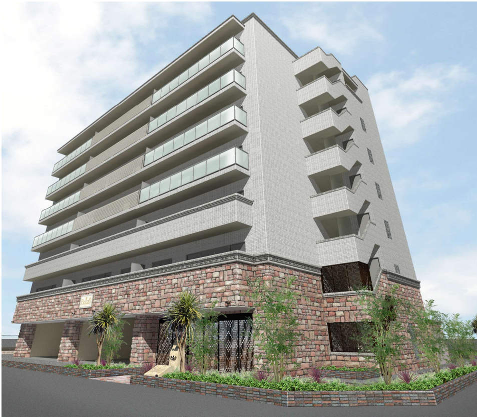
【外観 イメージパース】

当物件の最寄り駅は、阪急神戸本線・今津線の停車駅であり、西宮市内で最大級の乗降客数を誇る交通の要所「西宮北口」駅です。特急や通勤特急の利用が可能で、神戸・大阪の両方面へ優れたアクセス性を有しています。また、JR 東海道本線「甲子園口」駅へも徒歩 13 分でアクセスでき、多面的な交通利便性を備えています。周辺には「阪急西宮ガーデンズ」をはじめとする大型商業施設や生活利便施設が充実しており、都市の利便性を享受できる恵まれた住環境が整っています。